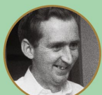
ジェームズ “ウサギ”