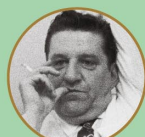
チャーリー “ギンパー”